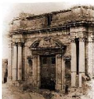
Portale della prima Università collegiata gesuitica in Europa. (XVI sec.)